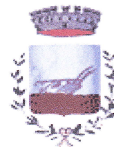
Comune di Camparada