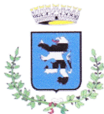
Comune di Lesmo

Per informazioni e iscrizioni contatta: 039 – 60.64.545 dalle 9.00 alle 12.00