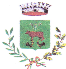
Comune di Correzzana